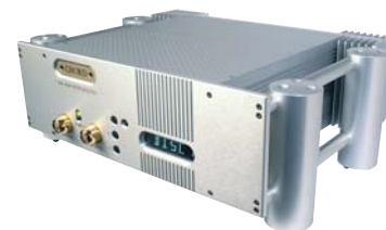
CHORD CPM 2600 : Prix : 6 100 euros