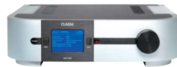
CLASSÉ CAP 2100 : Prix : 5 950 euros