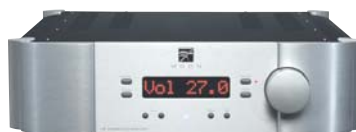
SIM AUDIO I-7 : Prix : 7 700 euros

Ces trois amplificateurs intégrés sont tous très talentueux mais différents. Toutefois le Edge tire admirablement bien son épingle du jeu. Il a plus de caractère que le Chord, même si ce dernier est plus puissant. Il est plus direct et euphonique que le Classé qui lui est plus consistant. Enfin il s'émancipe du Sim Audio par un côté très chantant et louangeur, alors que ce dernier impose à la musique enregistrée une exceptionnelle rigueur de restitution.